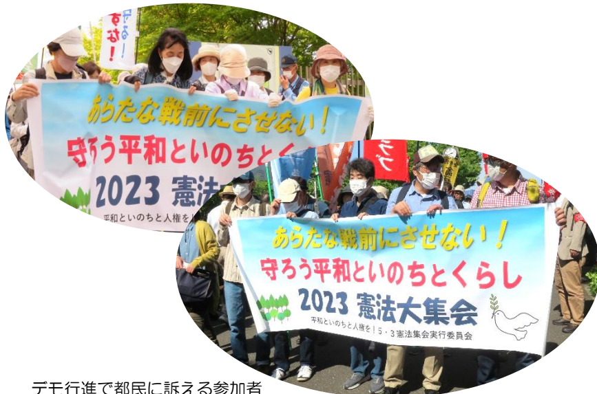
デモ行進で都民に訴える参加者