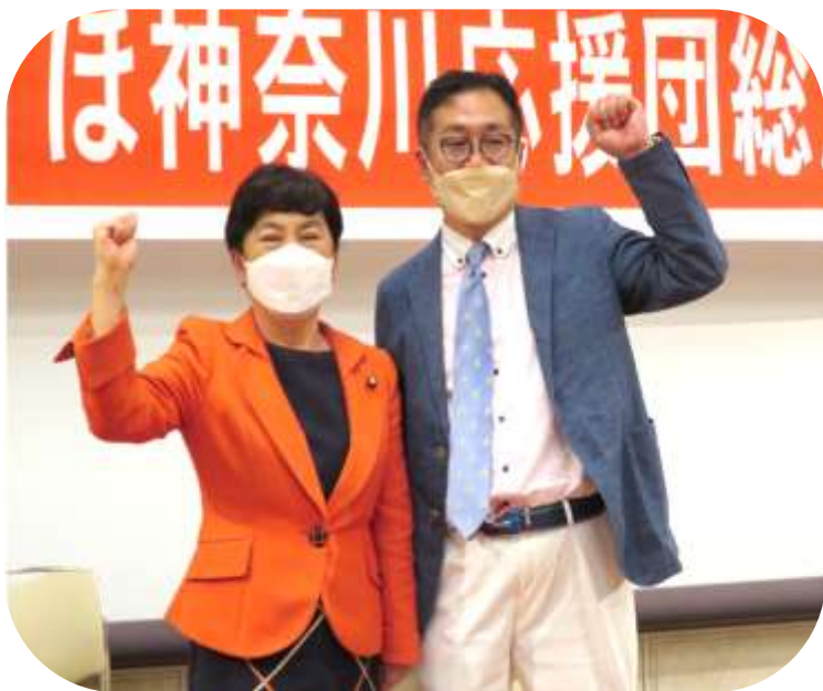
勝利を誓い合う福島みずほ党首と うつみ洋一選挙区予定候補